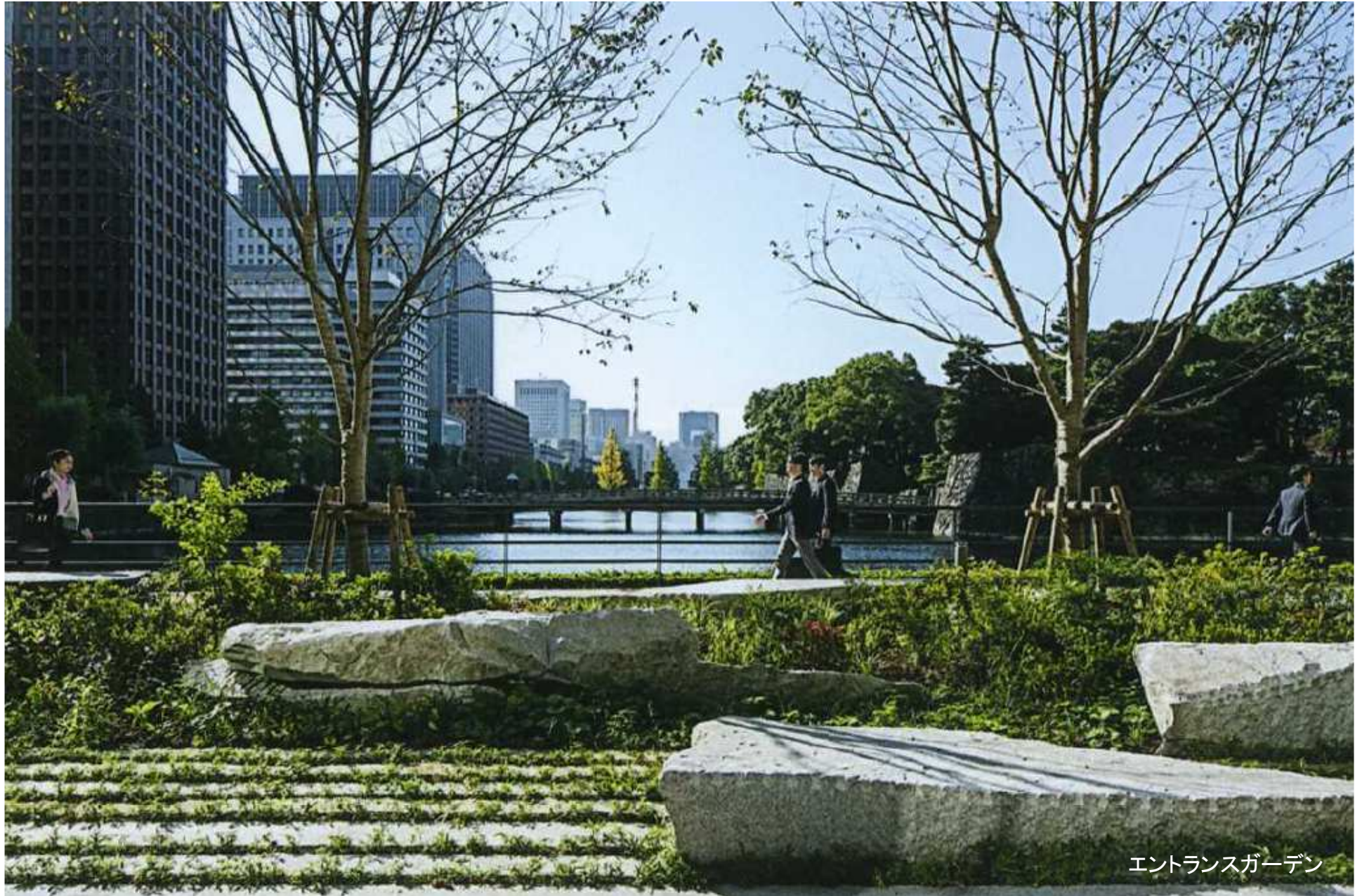
エントランスガーデン