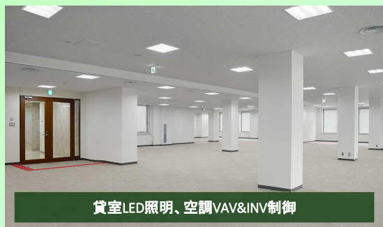
貸室LED照明、空調VAV&INV制御