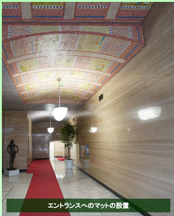
エントランスへのマットの設置