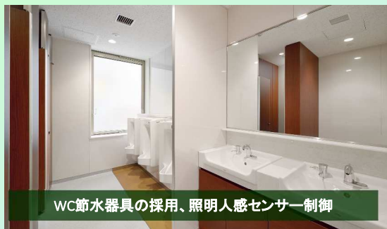
WC節水器具の採用、照明人感センサー制御